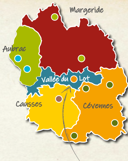
Le truc de Balduc

Au coeur du Valdonnez, le truc de Balduc constitue une version miniature des grands causses. Relié aux milieux agricoles et naturels environnants par la présence de haies bocagères, il abrite plusieurs espèces de rapaces protégées au niveau national, dont l'aigle royal, qui trouvent refuge dans ses falaises.