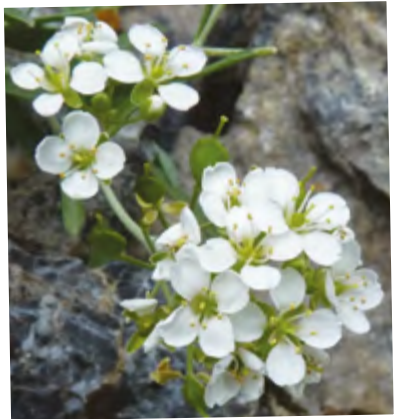
Corbeille d'argent à gros fruits

Inféodée aux milieux calcaires secs et rupestres, cette espèce protégée forme de très petits buissons ou coussinets blancs aux pieds des falaises et des murets.