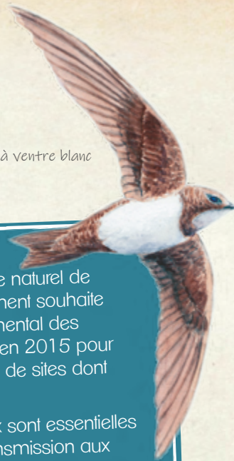
Martinet à ventre blanc

La diversité des paysages et du patrimoine naturel de la Lozère est une richesse que le Département souhaite préserver. Pour cela, un Schéma départemental des Espaces Naturels Sensibles a été voté en 2015 pour assurer la préservation d'une cinquantaine de sites dont 17 prioritaires.